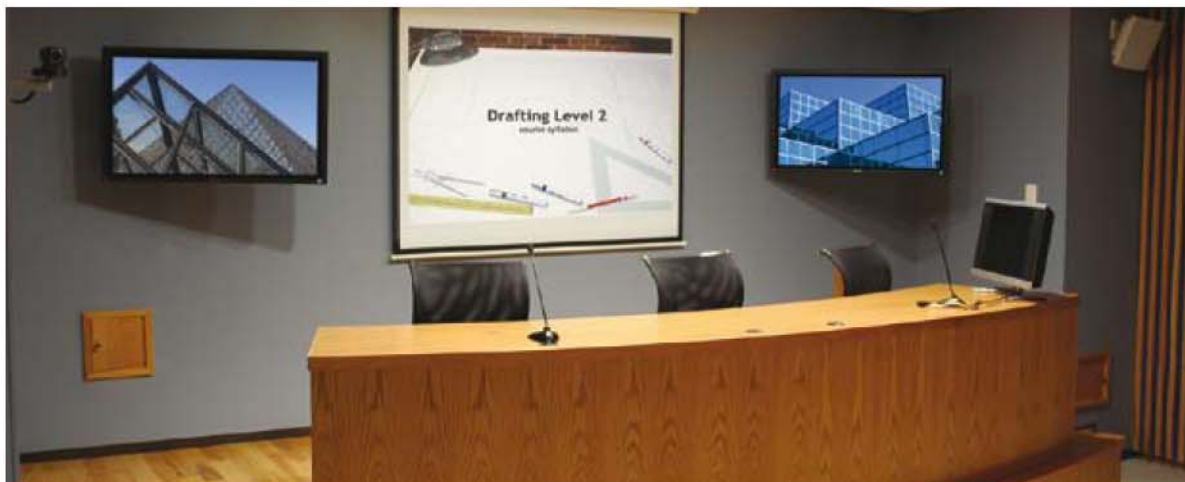
Sala de conferencias con sistema de control AV

Las cajas de conexiones empotrables en mesas son la solución perfecta para salas de formación y salas de conferencia.