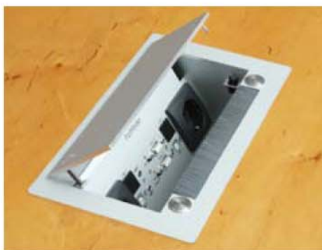
Caja de conexión empotrada en mesa