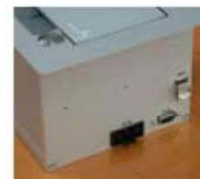
Caja en superficie