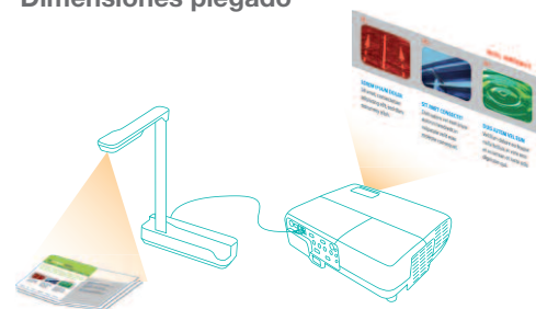
Conexión USB directa con proyectores Epson